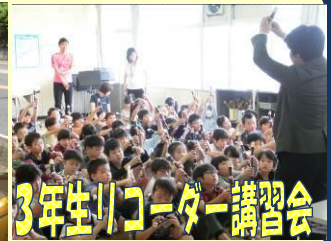
3年生リコーダー講習会